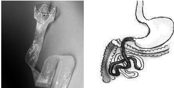
شکل ۲: اندوبریبر و نحوه ی قرار گرفتن آن در دوازدهه

در مدت سه ماه، خروج زودرس بین ۳۸/۱-۱۵/۴٪ بود که در مطالعه یک ساله خروج زودرس، ۳۸/۵٪ رسید. علل خروج زودرس اغلب، جابجا شدن اندوبریبر یا درد شکم بود. شایع ترین عوارض جانبی در این گروه هم درد شکم و تهوع و استفراغ بود که در اغلب موارد در هفته اول بهبود می یافت.