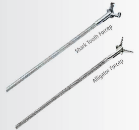
Shark Tooth Forceps