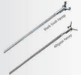
Shark Tooth Forceps