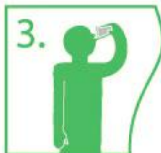
3. Empty the contents of the sachet onto the back of the tongue