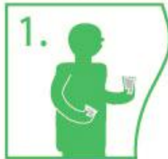
1. Open the sachet