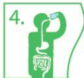
4. Wash down with some water or juice

Further information is available at: FERRING MIDDLE EAST P.O. Box 850845, Amman 11185, Jordan Tel: + 962 6 550 1000 | Fax: +962 6 550 1015 E-mail: marketing@ferring.com