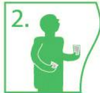
2. Tilt your head backwards