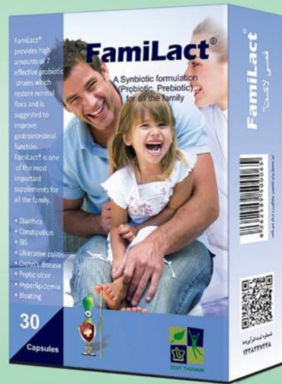
◀ برطرف کننده اختلالات شایع گوارشی