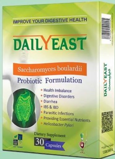
◀ مخمر سودمند، محافظ گوارشی