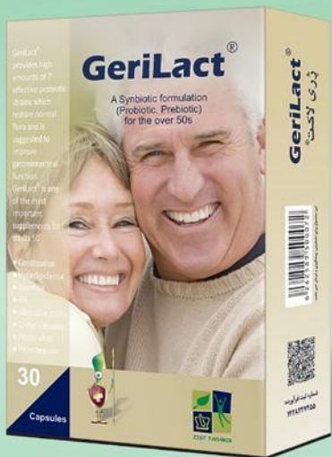
◀ درمان یبوست و سلامت قلب و عروق سالمندان