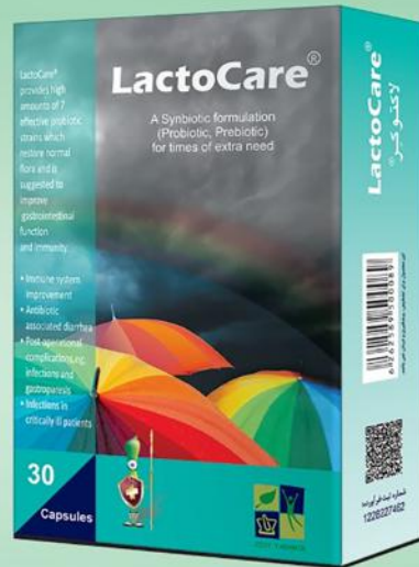
◀ کنترل التهاب و عفونت های گوارشی و بیمارستانی

تلفن مشاوره : ۰۷۷۴۹۵۰۰۷ - ۰۲۱ www.zisttakhmir.com