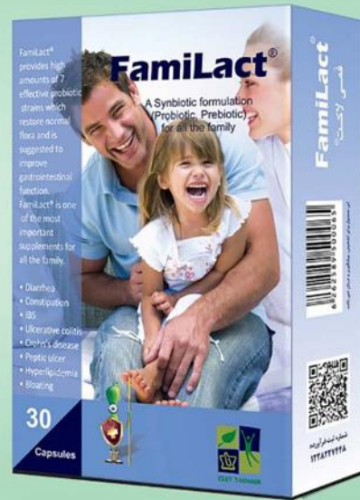
◀ برطرف کننده اختلالات شایع گوارشی