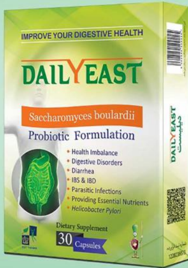
◀ مخمر سودمند، محافظ گوارشی