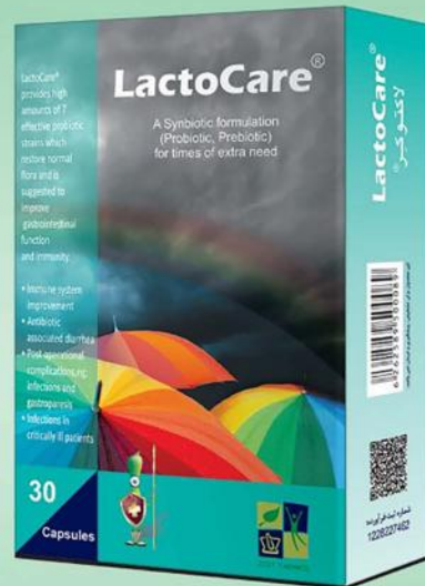
◀ کنترل التهاب و عفونت های گوارشی و بیمارستانی

تلفن مشاوره: ۰۷۷۴۹۵۰۰۷ - ۰۲۱ www.zisttakhmir.com