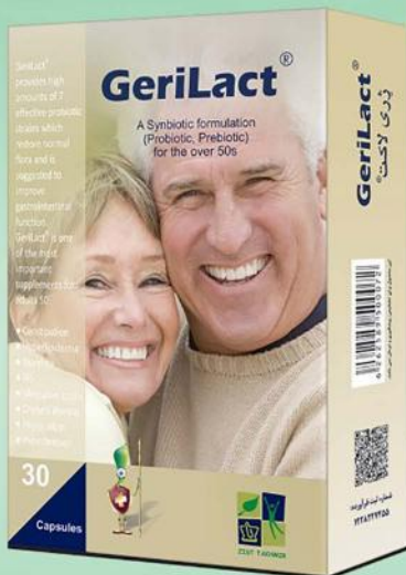
◀ درمان یبوست و سلامت قلب و عروق سالمندان