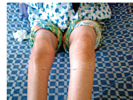
شکل ۲: پتشی و پورپورای اندام تحتانی بیمار

بیمار در روز پنجم بستری دچار درد و ادم یک طرفه اندام تحتانی چپ به همراه پتشی و پورپورای همان ناحیه گردید (شکل ۲).