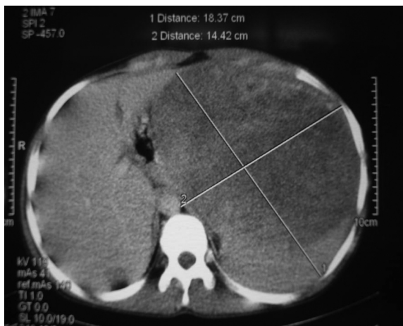
شکل ۱: سی تی اسکن بیمار با ماده حاجب

Corrected reticulocyte: 1.2% Albumin: 3.6 (3.5-5.2) gr/dl Total protein: 7.2 (6.2-8.2) gr/dl Wright, coombs Wright, mono test: negative ANA, Anti DNA (Elisa): negative