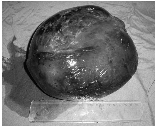
شکل ۲: طحال پس از جراحی

یافته های آسیب شناسی نیز در بیشتر موارد حکایت از تکثیر کانالهای عروقی بدون کپسول با اندازه های مختلف از کاپیلر (مویرگی) تا کاورنوی (حفره ای) دارد و بیشتر ضایعات کمتر از ۲ سانتی متر هستند. (۳)