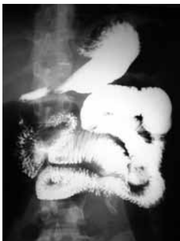
شکل ۱: گرافی باریوم روده باریک: افزایش ضخامت مخاطی ناشی از آسیت واضح و مختصر دیلاتاسیون قوسهای ژژنوم.