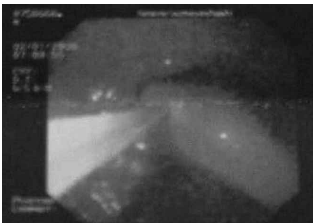
شکل ۴- بیرون آوردن مسواک پس از گیر انداختن آن توسط اسنر با آندوسکوپ

بیمار پس از خروج مسواک هیچ‌گونه علامتی نداشت و آندوسکوپی وی نیز طبیعی بود.