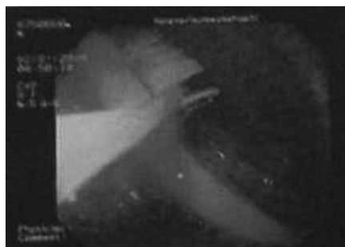
شکل ۲- تلاش برای گیر انداختن مسواک توسط اسنر با آندوسکوپ