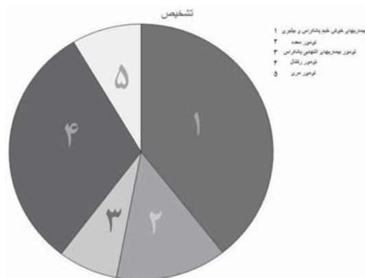
شکل ۲: پراکندگی تشخیص‌ها