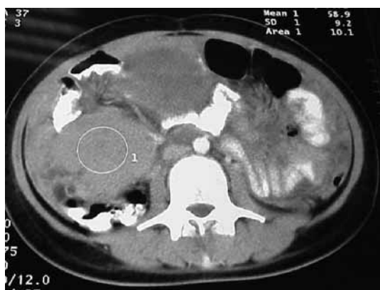
شکل ۲: توده شکمی در سی تی اسکن

بیمار با تشخیص قطعی لنفوم بورکیت، کاندید انجام شیمی درمانی شد و به انکولوژیست ارجاع داده شد که متأسفانه قبل از دریافت درمان و دو هفته بعد از تشخیص بیماری، به علت آمبولی حاد ریه فوت کرد.