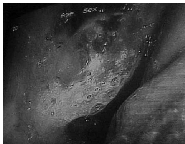
شکل ۱: تومور فوندوس معده

در بررسی سلولهای ایمنی *** نیز CD 3 ، CD 20 ، Ki 67 و LCA مثبت گزارش شد که تشخیص لنفوم بورکیت را تأیید کرد (Ki 67 = ۱۰۰٪).