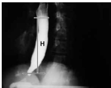
شکل ۱: اندازه‌گیری ارتفاع ستون باریم

در این بررسی تصاویر رادیوگرافی اسکن شدند و اندازه واقعی به صورت دقیق با کامپیوتر با استفاده از نرم‌افزار آدوب آکروبات ۶ محاسبه شد (شکل ۱ و ۲). نتایج نشان دادند که سطح به عنوان یک وسیله عینی دال بر تخلیه مری بهتر از ارتفاع و علائم بالینی می‌تواند